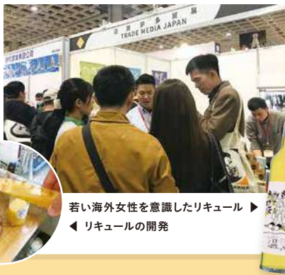
若い海外女性を意識したリキュール ▶ リキュールの開発 ◀