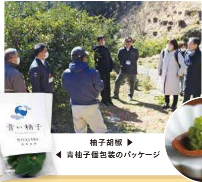
柚子胡椒 ▶ 青柚子個包装のパッケージ ◀