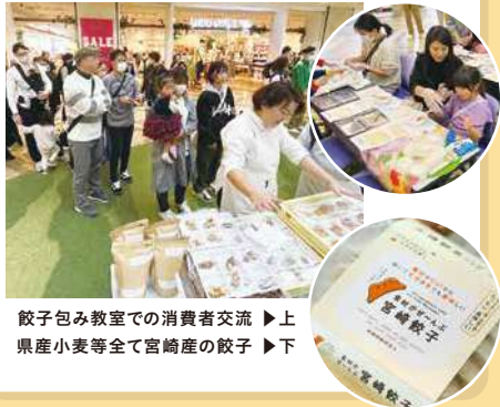
餃子包み教室での消費者交流 ▶ 上 県産小麦等全て宮崎産の餃子 ▶ 下