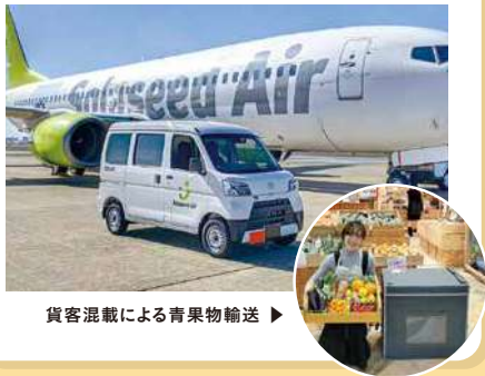
貨客混載による青果物輸送 ▶