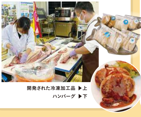
開発された冷凍加工品 ▶ 上 ハンバーグ ▶ 下