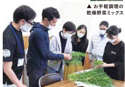
▲ お手軽調理の乾燥野菜ミックス